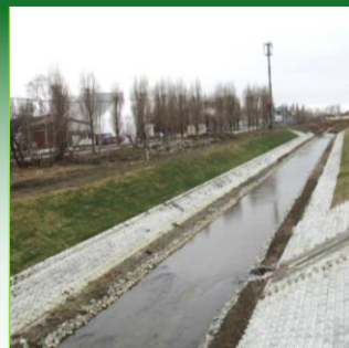
気候変動に対する適応に関する事業