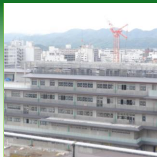
グリーンビルディングに関する事業