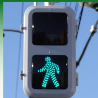
省エネルギーに関する事業